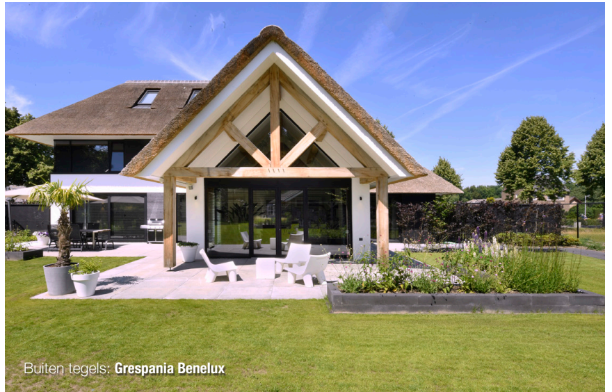
Buiten tegels: Grespania Benelux