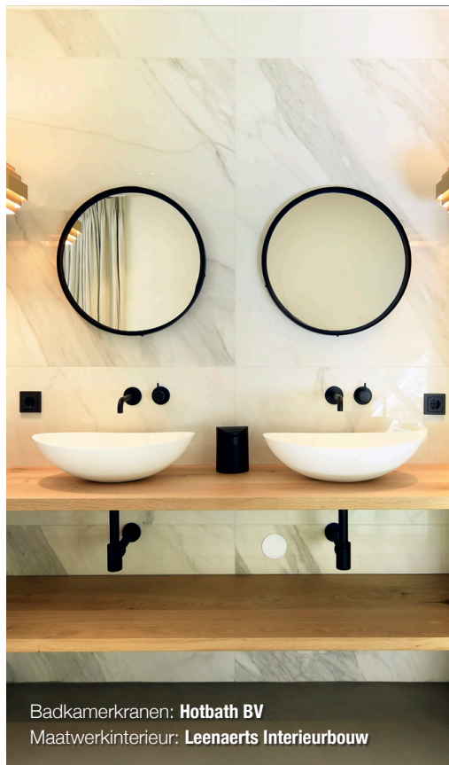
Badkamerkranen: Hotbath BV Maatwerkinterieur: Leenaerts Interieurbouw