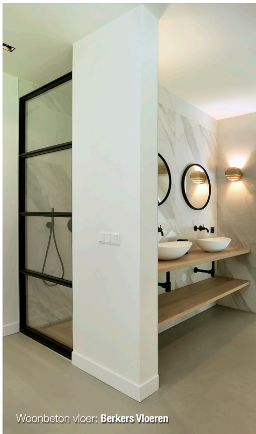
Woonbeton vloer: Berkers Vloeren