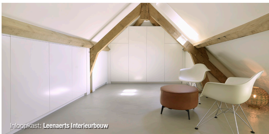
Inloopkast: Leenaerts Interieurbouw

Voor de kinderen is er op de begane grond een vleugel met speelkamer gecreëerd naast de woonkamer. De bewoner vertelt: "Kinderen willen in verbinding zijn met hun ouders, dus daar is de locatie van de speelkamer op gemaakt. Zij hebben hun eigen plek, maar wij zijn altijd in de buurt." Grenzend aan de speelkamer ligt de logeerkamer met badkamer. Gasten hebben hierdoor een eigen plek en ook de bewoners genieten van hun privacy op de eerste verdieping. Aan de achterkant van het huis krijg je ook een goede indruk van de enorme breedte van de villa; één van de balken loopt over de volledige 22 meter. De duurzame villa is zelfvoorzienend in de totale energiebehoefte door middel van een warmtepomp en zonnepanelen.